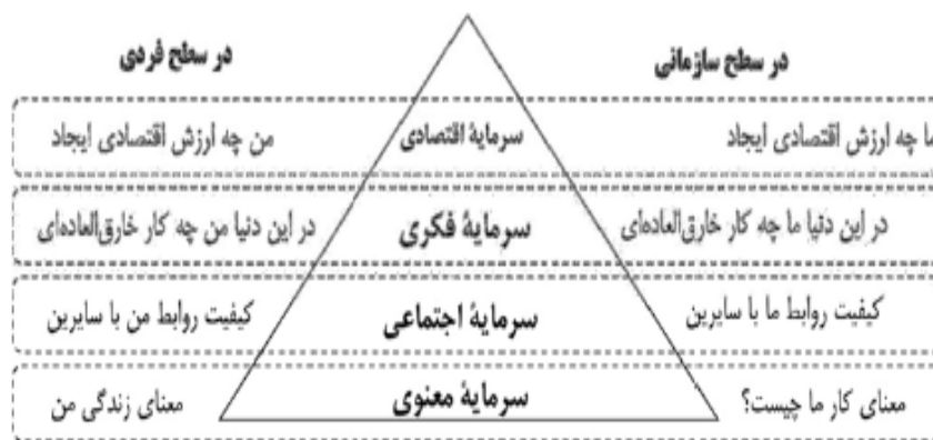
شکل ۱. ترتیب سرمایه‌های اقتصادی، فکری، اجتماعی و معنوی (مرادی، ۱۳۹۴، ص ۴۹)

امروزه نیز مفهوم سرمایه معنوی به عنوان پایه اصلی سرمایه‌های سازمانی مطرح شده است. نظریه‌پردازان این عرصه تلاش کرده‌اند تا نقش این سرمایه را در شکل‌گیری سایر سرمایه‌های سازمانی و بهبود ارزش افزوده سازمان‌ها نشان دهند (گل‌پرور و همکاران، ۱۳۹۳، ص ۳۶-۳۱؛ مرادی، ۱۳۹۴، ص ۴۸). در شکل ۱ ترکیب و ترتیب سرمایه‌های یادشده نشان داده شده است.