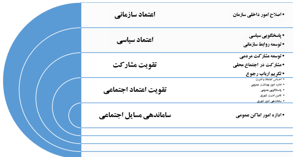
شکل ۲. شبکه مضامین یافته‌های تحقیق